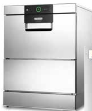
Osmosi inversa HYDROLINE PURE RO-I