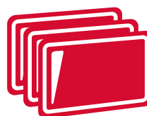
TEGLIE DI ALLUMINIO