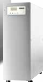
Osmosi inversa HYDROLINE PURE RO-S