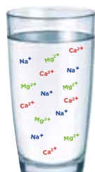
ACQUA NON TRATTATA