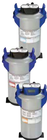
Demineralizzatore parziale HYDROLINE STAR PD

La demineralizzazione parziale rimuove dall'acqua di rete quella parte di minerali che è responsabile dell'alcalinità. Per questo è idonea per il lavaggio di bicchieri, quando l'alcalinità dell'acqua di rete ha una percentuale molto alta sulla durezza complessiva. Non ci sono limiti per il suo utilizzo nel lavaggio delle stoviglie.