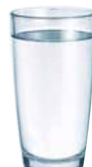
ACQUA DESALINIZZATA / ACQUA OSMOTIZZATA