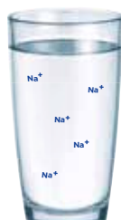
ACQUA PARZIALMENTE DESALINIZZATA