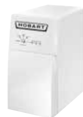
Impianto addolcitore HYDROLINE PROTECT SE-H