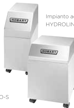
Impianto addolcitore HYDROLINE PROTECT SD-H