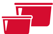
CONTENITORI DI PLASTICA